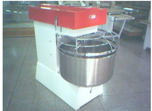
AMASADORA MANUAL DE 2 VELOCIDADES MODELO BAM 1