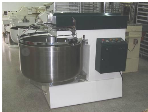
AMASADORA AUTOMATICA DE 2 VELOCIDADES MODELO BAM 2