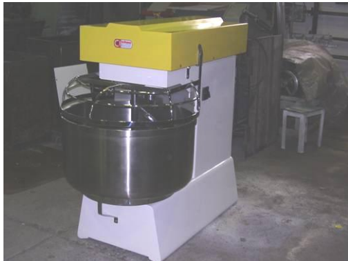
AMASADORA MANUAL DE 1 VELOCIDAD MODELO BAM 1